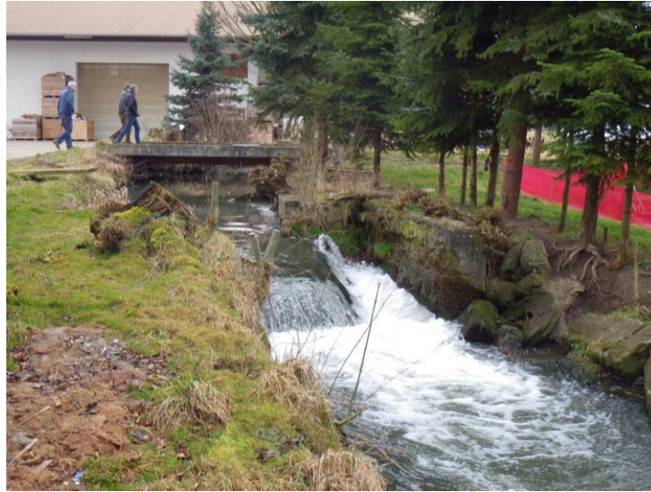
Abb. 8: Absturz Marktmühle

Die Mühle im Amtsbezirk Ingolstadt wurde bereits rückgebaut. Lediglich ein hoher Absturz ist vorhanden.