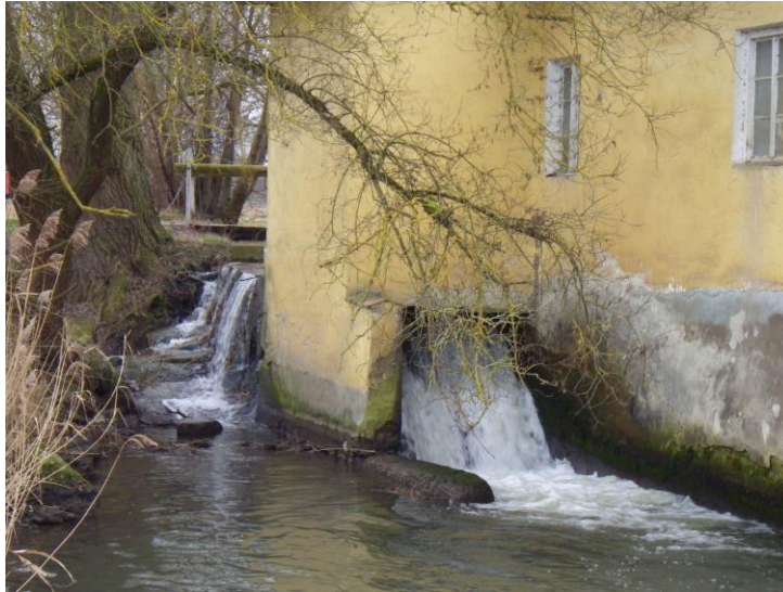
Abb. 10: Oggermühle

Die Oggermühle befindet sich im Amtsbereich Ingolstadt. Sie ist derzeit noch in Betrieb.