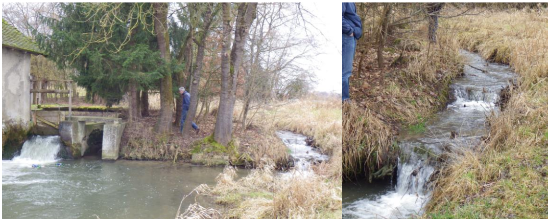
Abb. 6: Einleitung Umgehung Grasmühle