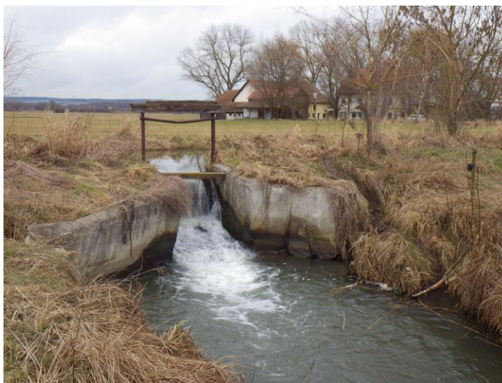
Abb. 11: Teilungswehr

Die einfachste Möglichkeit die Durchgängigkeit herzustellen wäre eine Umgehung über den Vohbach zu führen. Hierfür müssten lediglich Ein- und Ausleitung optimiert werden.