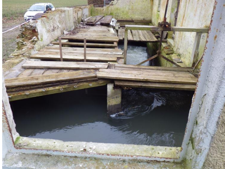
Abb. 13: Moosmühle

Das Gebäude der Moosmühle ist bereits rückgebaut. Lediglich das Treibwerksgebäude steht derzeit noch. Das Wasserwirtschaftsamt Ingolstadt hat bereits im Jahre 2007 einen Entwurf zur Herstellung der Durchgängigkeit erstellt. (Siehe Anlage 4).