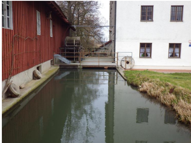
Abb. 3: Schlagmühle

Die Schlagmühle befindet sich im Amtsgebiet Donauwörth. Sie ist als nicht durchgängig einzustufen und immer noch in Betrieb. Es handelt sich um ein ehemaliges Sägewerk mit einer Francisturbine. Der geschätzte Ausbau liegt bei etwa 800l und einer Leistung von 8-10 KW.