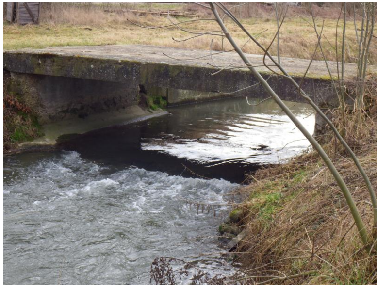
Abb. 1: Absturz Rahmenbrücke

Hierbei handelt es sich um eine ausgespülte Rahmenbrücke. Sie stellt demnach keinen „echten“ Absturz dar. Trotzdem ist die entstandene Schwelle als nicht bzw. als eingeschränkt durchgängig einzustufen. Es wäre zu prüfen, ob die Brücke tatsächlich notwendig ist und somit die Möglichkeit bestände diese zu entfernen. Anderenfalls müsste entweder ein neues Brückenbauwerk errichtet werden bzw. der Kolk an der bestehenden Brücke mit z.B. verschieden großen Wasserbausteinen und Sohlsubstrat durchgängig gestaltet werden.