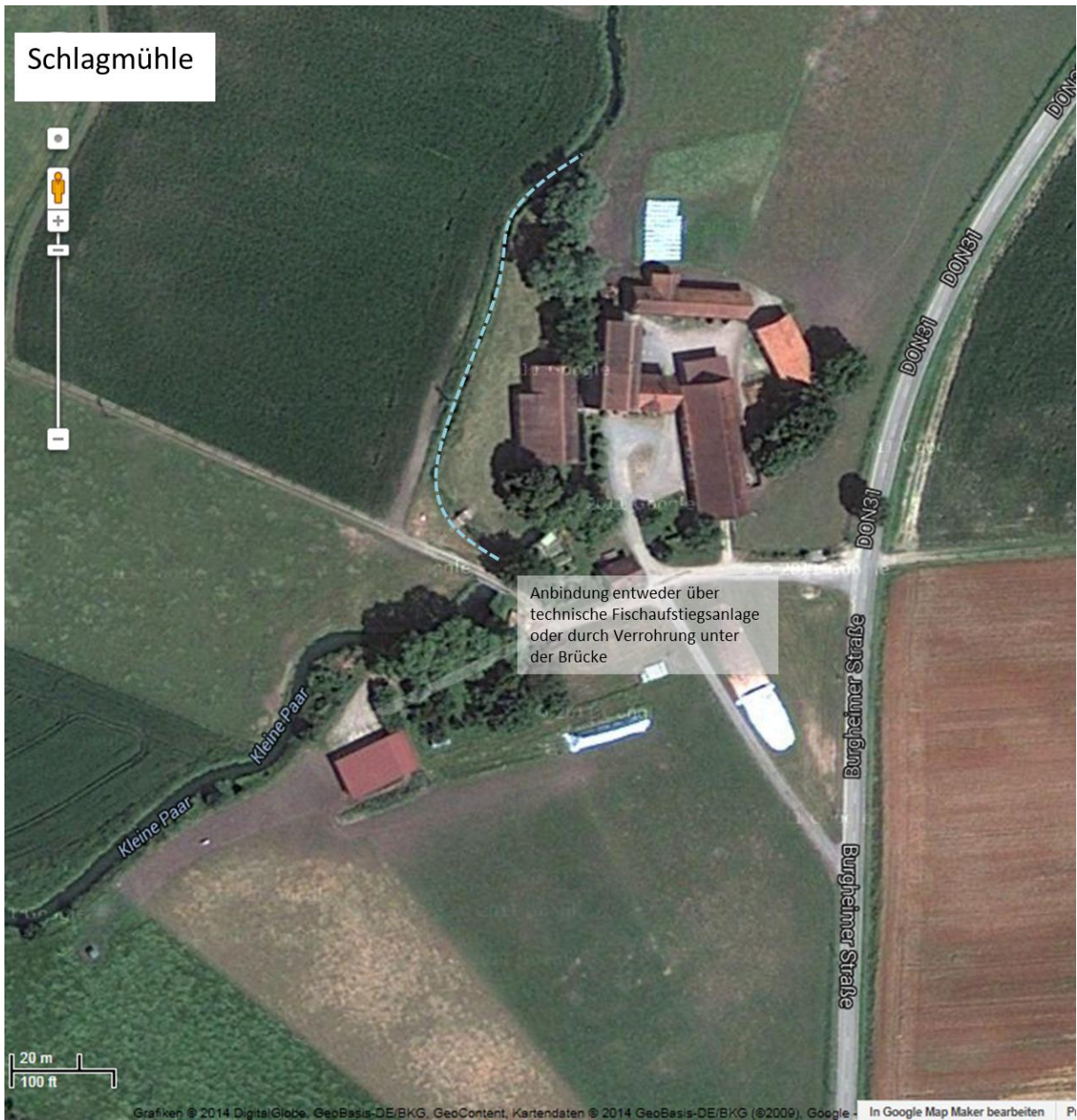
Abb. 4: Maßnahmenplan Schlagmühle