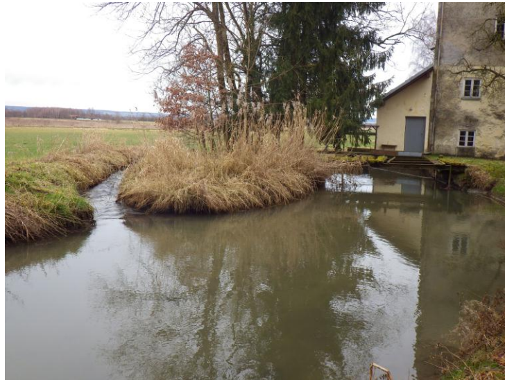
Abb. 5: Grasmühle

Die Grasmühle befindet sich im Amtsbereich Ingolstadt. Sie ist nicht mehr in Betrieb. Das bereits vorhandene Umgehungsgerinne kann mittels einfacher Umbauten als Umgehungs- bach fungieren. Lediglich die Einleitung müsste optimiert werden.