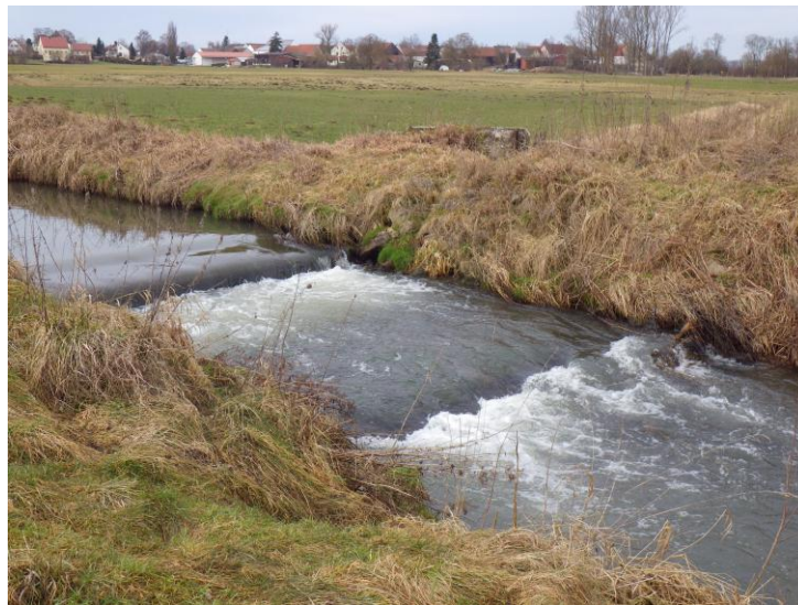
Abb. 2: Absturz oberhalb Bruckmühle

Optional soll die biologischen Durchgängigkeit durch den Umbau des Dückers hergestellt werden (z.B. raue Rampe).