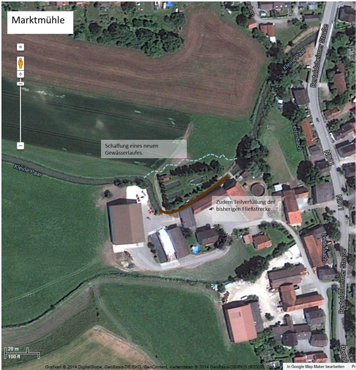
Abb. 9: Maßnahmenplan Marktühle