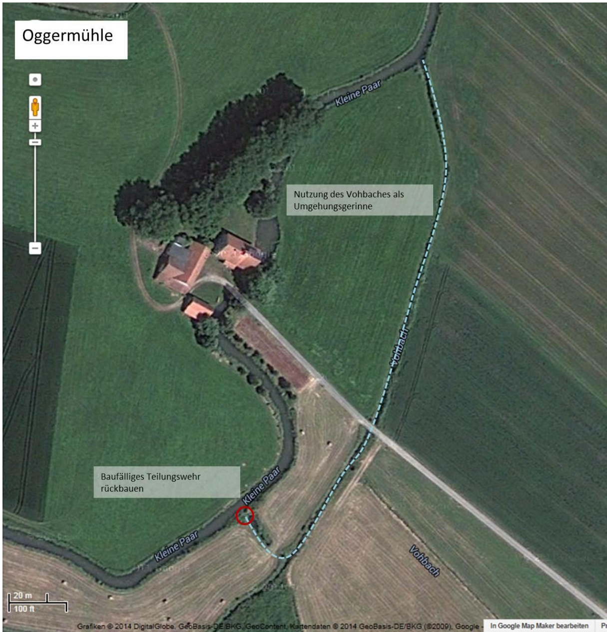
Abb. 12: Maßnahmenplan Oggermühle